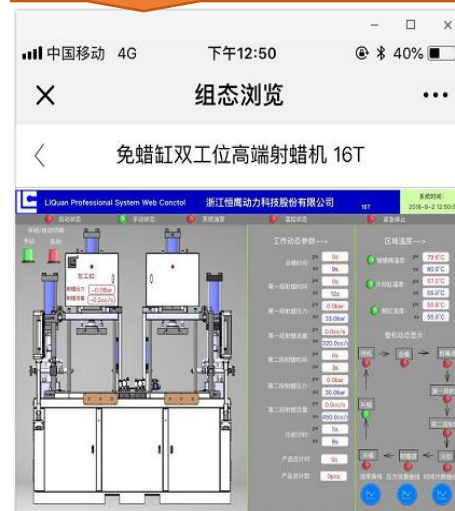
Liquan Cloud 监控界面